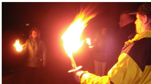
Kerzen- und Fackellicht steht einfach jedem gut: macht den Teint samtig und gibt jugendliche Gesichtszüge ...