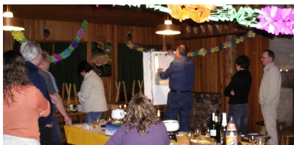
Eifriges Raten, was Bige da am Zeichnen ist