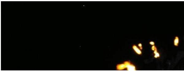
... und danach kam der Morgen

Nach dem heiteren Spielvergnügen gönnten sich die einen nochmals einen dritten(!) Aufsud der Bouillonbrühe und das Dessert wurde dann angepeilt mit einem starken Kaffee. Obwohl, keine Spur von Müdigkeit war uns anzumerken. Diskutierfreudig ging es angeregt weiter zu Themen von Gott und die Welt bis hin zu unserem 4x4 Club bis in die frühen Morgenstunden gegen 5 Uhr hinein.