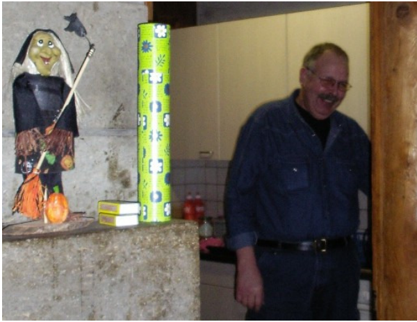
Wettlachen der Hexe und Bige; oder ist es die Freude auf den Kaffee zur Morgenstunde...