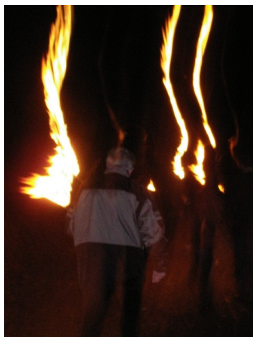
Fackel schön links halten, es stürmt von rechts... (keine politische Anspielung)

Begriff des Anstosses in dieser autonährischen Kategorie fand eindeutig der „Schnorchel“. Warum weiss ich heute noch nicht!? Der Begriff war absolut logisch gezeichnet, die Umgebung wurde sogar ansatzweise korrekt angedeutet... OK zugegeben, der Begriff hätte auch unter Sommerferien kategorisiert werden können, aber wir sind ja vom 4x4 Club.